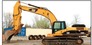
(2008) Caterpillar 330DL, quick attach, pouce hyd. (moteur rebuilt moins de 500 hrs.) ( 12,800 hrs.)