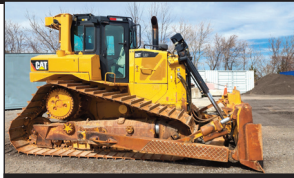
(2014) Caterpillar D6T LGP (10,700 hrs./Idle 2,798 hrs.)