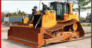
(2014) Caterpillar D6T LGP (10,700 hrs./Idle 2,798 hrs.)