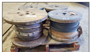
(NEUF/NEW) Plusieurs rouleaux câble acier 660" x 1/2"

INSCRIVEZ-VOUS À WWW.LIONGAUTHIER.HIBID.COM POUR MISER