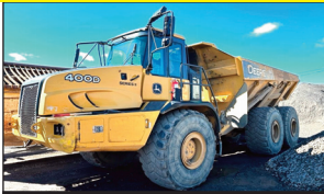
(2012) John Deere 400D Series II (6 x 6) (14,800 hrs.)

ACHAT DISPONIBLE AVANT ENCAN / BUY NOW AVAILABLE BEFORE AUCTION