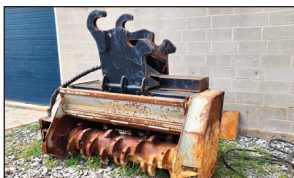
Débroussailluse/Mulcher FAE EX-150 quick attach pour excavator