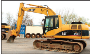
(2007) Caterpillar 318CL quick attach hyd. ( 11,145 hrs.)