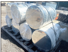
(NEUF/NEW) KENWORTH Plusieurs réservoirs Diesel & Hydraulique