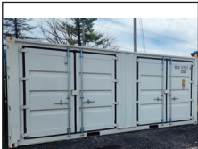
(NEUF/NEW) Conteneur 20' avec 4 portes de côtés