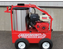
(NEUF/NEW) : Magnum Gold 4000 Laveuse pression eau chaude