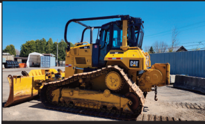
(2018) Caterpillar D6N LGP avec winch Paccar (5,575 hrs./ 1,500 hrs Idle)