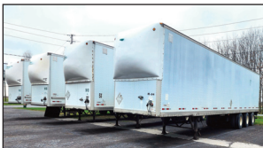
(1 de 4) 2022 à 2010) Remorques Manac 53' 3 essieux