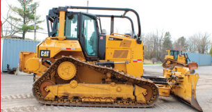
(2018) Caterpillar D6N LGP avec Winch Paccar (5,575 hrs./Idle 1,500 hrs.)

Achat disponible maintenant / Buy now available before auction