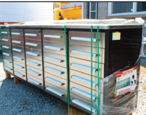
(NEUF / NEW) Coffres d'outils