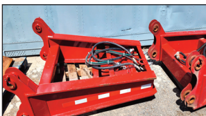
MANAC Extension de Gooseneck