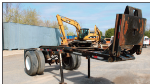
(2010) Jeep Dolly LORNES 1 essieu avec extension de Gooseneck