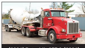
(2004) Peterbilt 357 & (2004) McNeilus 12.5 cu.yd. Concrete Mixer trailer