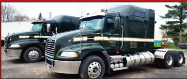
(1 de 2) (2018 & 2016) Mack Pinnacle, (14/46) automatic (676,000 kms)