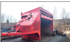
Tamiseur "Metso" Read 150B