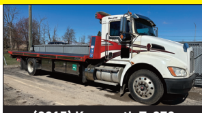
(2015) Kenworth T-370 automatique, plateforme hyd. NRC Rollback ( 399,000 kms)