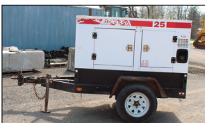
(1 de 2) Génératrice Magnum/Generac Gen set 25 Kwa