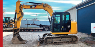
(2018) Caterpillar 307 E2, lame avant, quick attach pin grabber (4,700 hrs.)