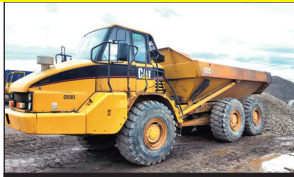
Caterpillar 725 (6 x 6) (14,600 hrs.)