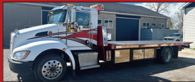
(2015) Kenworth T-370 plateforme NRC Rollback, automatique (399,000 kms)

Consignation acceptée / Consignment still accepted