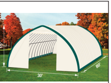
(NEUF/NEW) Abri/Shelter 30' x 80' x 15'