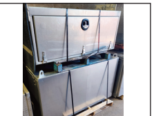
(NEUF/NEW) plusieurs coffres Stainless 36", 48" & 60"