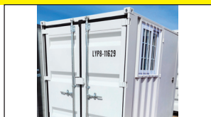
Neuf/New : Conteneur 8' x 8'