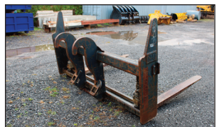
Set de fourches/Forks Caterpillar quick attach Fusion