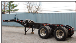
(2012) Jeep Dolly gerry's 2 essieux