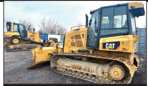
(2018) Caterpillar D5K2 LGP lame 6 positions (3,650 hrs.)