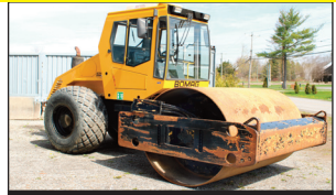
Bomag BW-211D ("84") vibreur (4,500 heures)