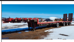
(2022) Manac dropdeck 53' 4 essieux (air lift) rampes arrières