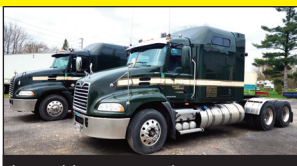
(1 de 3) [2018 & 2016] Mack Pinnacle CXU613, essieux 14/46, automatique (676,000 kms)