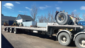
(2014) Manac dropdeck 48' 3 essieux (rampes avant & arrières)