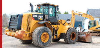
(2014) Caterpillar 950K (11,700 hrs./Idle 5,800 hrs.)