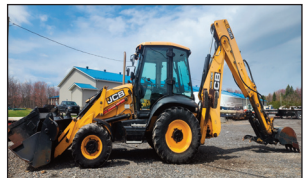
(2010) Pépine JCB 3CX-15EC bucket 4/1, pouce hyd. boom extensible

ACHAT DISPONIBLE AVANT ENCAN / BUY NOW AVAILABLE BEFORE AUCTION