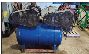
Compresseur à air Industriel Devilbiss (ex Hydro-Québec)