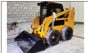
(NEUF/NEW) : 2024 CHERY C-185 chargeur compacte/skid steer