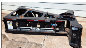
(1 de 2) TRAIL KING spreader extension