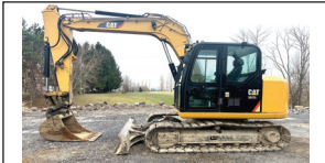
(2018) Caterpillar 307 E2, lame avant, quick attach pin grabber, aux hyd. (4,700hrs.)