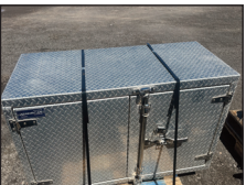
(NEUF/NEW) Plusieurs coffres aluminium)