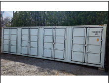
(NEUF/NEW) Conteneur 40' x 9'6" (High cube) avec 4 portes de côtés